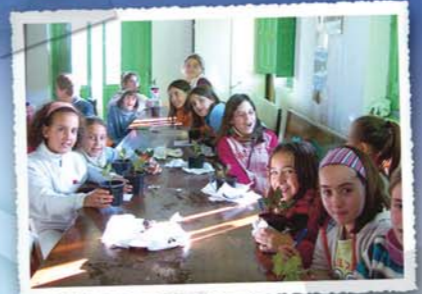
Talleres de educación ambiental