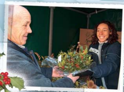
Nuestros puntos de venta en Soria antes de Navidad Plaza de Herradores y Centro Comercial las Camaretas