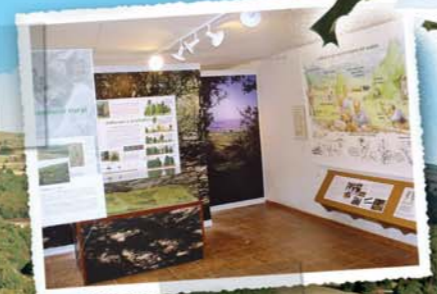
Visitas al aula de interpretación "La Casa del Acebo"