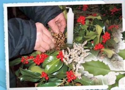
Talleres de artesanía