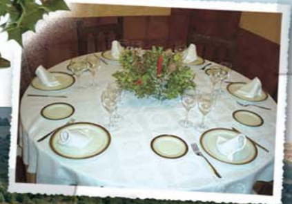
Servicios de decoración