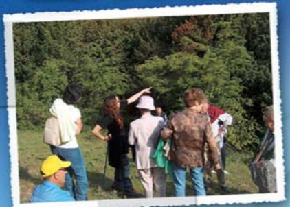
Rutas guiadas por el Acebal de Garagüeta (distintos recorridos)