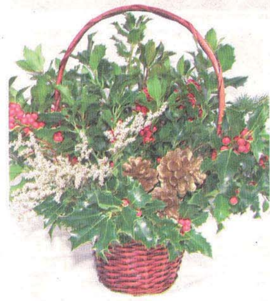
Uno de los centros florales que se realizan en El Acebarillo.