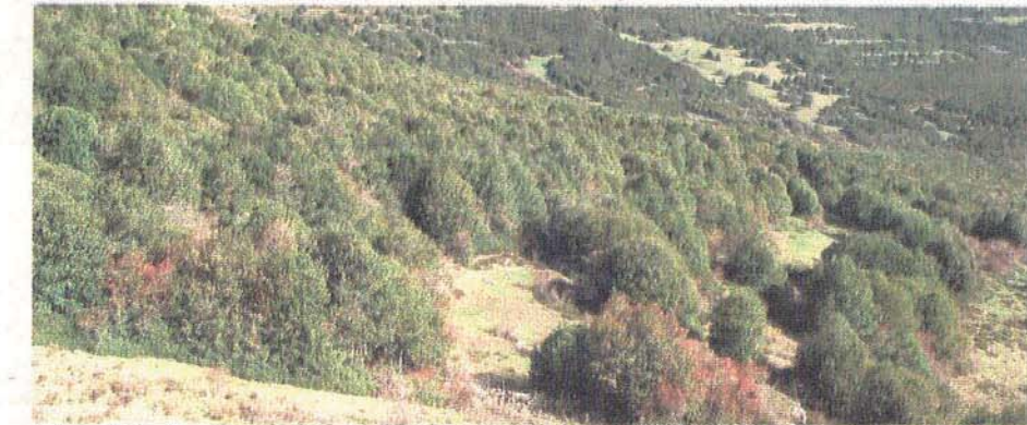
Vista panorámica de los acebales que se encuentran entre Arévalo de la Sierra y la Sierra de Montes Claros.

J.C. En noviembre del 2007, el Consejo de Gobierno de la Junta de Castilla y León aprobó el Plan de Ordenación de los Recursos Naturales (Porn) del Acebal de Garagüeta, lo que supuso el paso previo a su declaración como Espacio Natural Protegido en la modalidad de Reserva