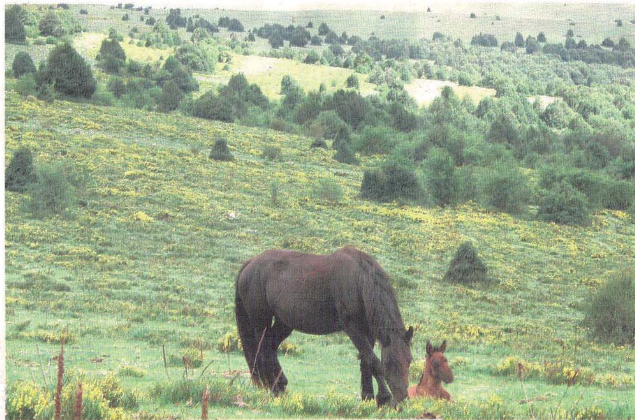
Un caballo comiendo dentro del paraje del Acebal de Garagüeta.

Aunque esta empresa en expansión no sólo se dedica a los ramilletes de acebo, ya que a nivel provincial, ofertan centros florales artesanos, guirnaldas y, en general todo tipo de adornos navideños y de decoración, para todo tipo de servicios, tanto para particulares como para empresas. También, a partir de las ramas que extraen, están recuperando poco a poco el aprovechamiento de la madera, para realizar el torneado y pinograbado. Otra de las opciones que te brinda esta pequeña empresa de Torrearévalo, es dar a conocer el impresionante