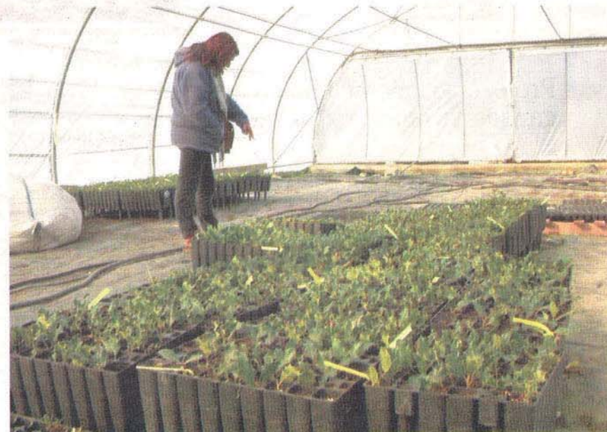
Vivero en el cual esta empresa de Torrearévalo cuida y prepara el acebo para su posterior venta.

Lo más adecuado es elevar la cantidad de agua en verano y moderarla durante el resto del año. Quizá necesite un poco de abono rico en nitrógeno para fortalecer su crecimiento. No admite bien los trasplantes, pero sí la poda. Durante los meses fríos podemos proceder a realizar un acolchado en el suelo que lo proteja. Su multiplicación se realiza por semillas, aunque esta opción sería bastante lenta, por lo que también se efectúa por esquejes.